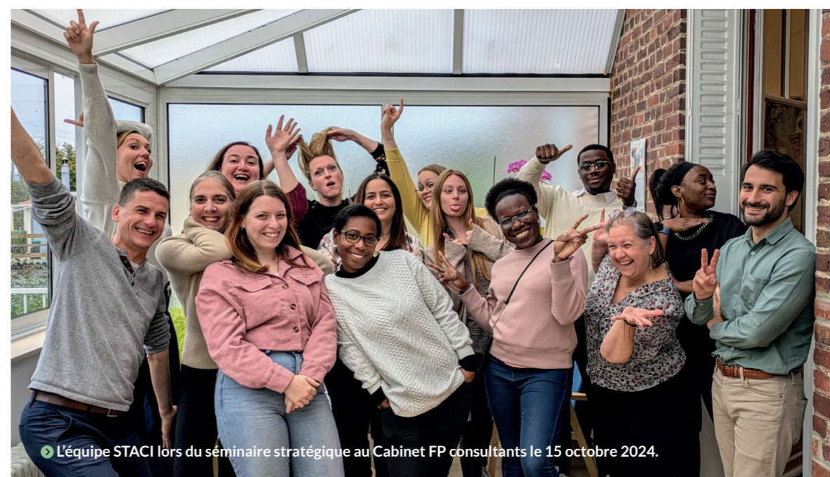
➤ L'équipe STACI lors du séminaire stratégique au Cabinet FP consultants le 15 octobre 2024.

Et enfin par le développement d'actions sociétales : travailler avec des prestataires à mission, intervenir auprès des localités dans lesquelles nous sommes situés. Le but étant d'engager l'ensemble de nos partenaires et de nos collaborateurs dans cette démarche RSE. ●