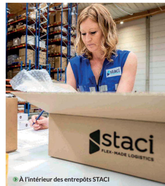
➤ À l'intérieur des entrepôts STACI