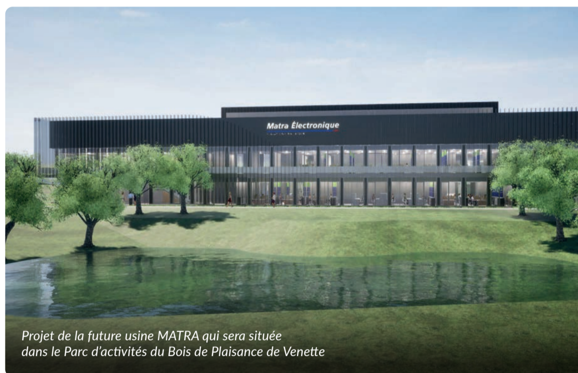
Projet de la future usine MATRA qui sera située dans le Parc d'activités du Bois de Plaisance de Venette

Je dirais que l'epost-it est une donnée d'entrée qui après peut se rediriger vers l'un des autres piliers. L'avantage étant que c'est direct entre l'émetteur et l'amélioration continue. Ensuite, nous rencontrons la personne afin de l'accompagner : soit directement avec elle sur son poste (Gemba Walk), soit en organisant si nécessaire un chantier d'amélioration continue pluridisciplinaire.